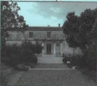
Les jardiniers du Rayol