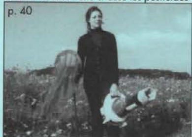
Quand la coccinelle chasse les pesticides